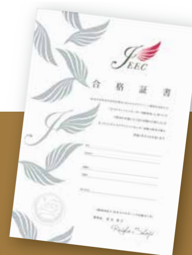
JEOマークの入ったJECC合格証書